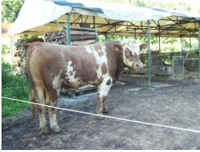
Heutiger Tigerbulle mit der typischen Zeichnung

Grüne Post: Wir bedanken uns für dieses Gespräch und wünschen Ihnen und Ihrer Arbeit viel Erfolg!